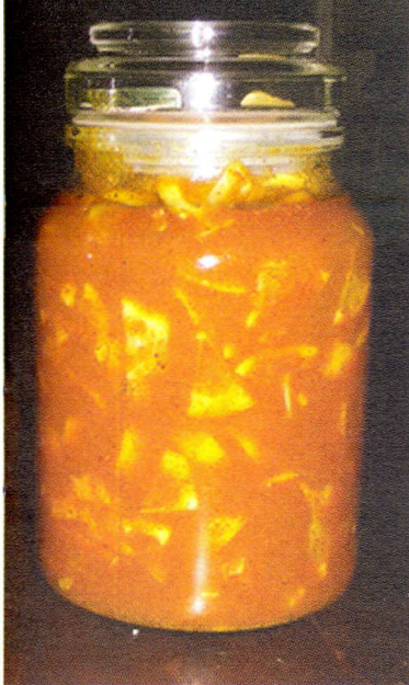
Chanh tám gia vị

cứ năm 1991 cho biết có một người quá mẫn với bixin, sắc tố trong hạt Điều.