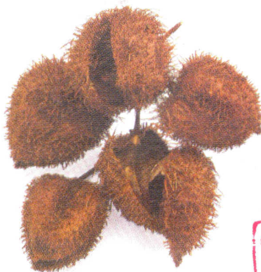
Trái Điều nhuộm