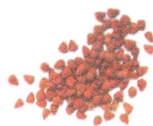
Hạt Điều nhuộm