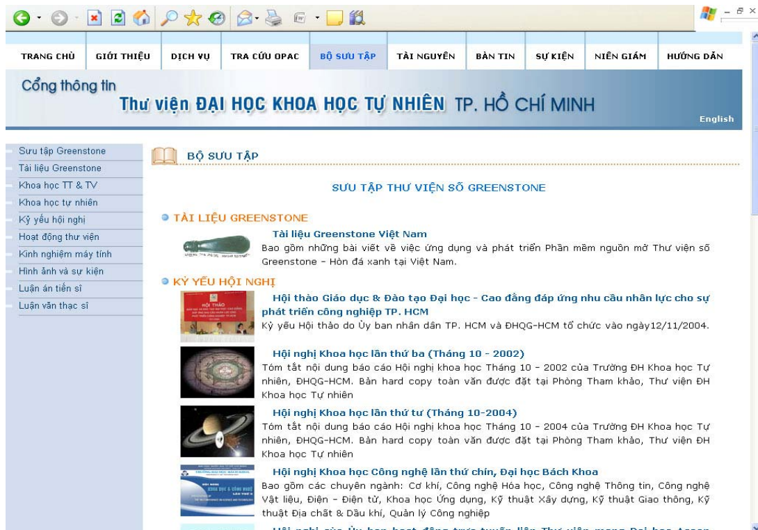
Hình 3: Greenstone đã được Việt hóa hoàn toàn với nhiều tính năng ưu việt