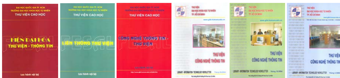
Bản tin điện tử Thư viện Cao học

Từ năm 2002 đến nay, những khóa tập huấn do NSL phối hợp với FESAL được tổ chức quy mô và chất lượng được