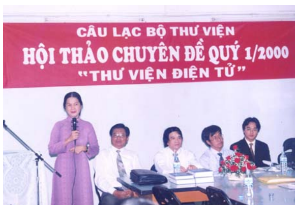
Hội thảo chuyên đề của Câu lạc bộ Thư viện tại Thư viện Cao học và thư viện thành viên