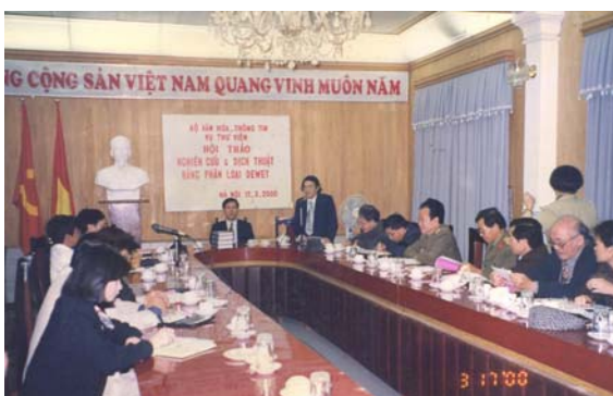
Hội thảo nghiên cứu và dịch thuật Bảng Phân loại Dewey tại Bộ Văn hóa Thông tin 17/3/2000

Các khóa tập huấn nghiệp vụ thông tin thư viện được Thư viện cao học tổ chức đều đặn và thu hút nhiều đồng nghiệp ở nhiều cơ sở thư viện khác nhau. Nhằm nâng cao hiệu quả đào tạo, Thư viện Cao học đã phát hành một số giáo trình và sách chuyên ngành do ĐHQG xuất bản như: “ Chọn tiêu đề đề mục cho thư viện ”, “ Tổng quan khoa học thông tin và thư viện ”, “ Sổ tay quản lý thông tin – thư viện ”, “ Hướng dẫn thực hành phân loại thập phân Dewey .”