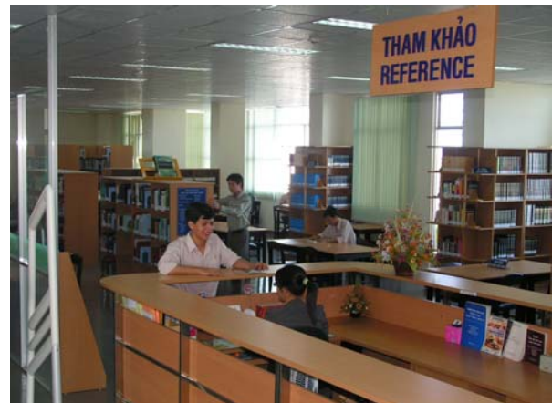
Thư viện Đại học Khoa học Tự nhiên tiên phong trong việc xây dựng Phòng Tham khảo