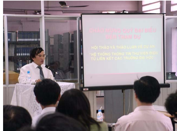
Hội thảo về Dự án “ Hệ thống thông tin thư viện điện tử liên kết các trường đại học ”

Hội đồng đại học TP. HCM, NSL được giao nhiệm vụ nghiên cứu để xây dựng dự án “ Hệ thống thông tin thư viện điện tử liên kết các trường đại học ”. Dự án được giao trường ĐH Khoa học Tự nhiên làm chủ đầu tư. Phạm vi liên kết của dự án bao gồm các trường ĐH Kỹ thuật, ĐH Sư phạm, ĐH Kinh tế, ĐH Y-Dược, ĐH Công nghiệp, ĐH Sư phạm Kỹ thuật, ĐH Mở - Bán công, ĐH DL Kỹ thuật Công nghệ, ĐH Khoa học Tự nhiên và Trung tâm Khoa học Công nghệ TP. HCM. Trong năm nay NSL cũng tiến hành dự án “ Cải tạo và Nâng cấp Thư viện ĐH Khoa học Tự nhiên ” bao gồm hai nội dung: di dời thư viện đến tòa nhà 11 tầng và xây dựng