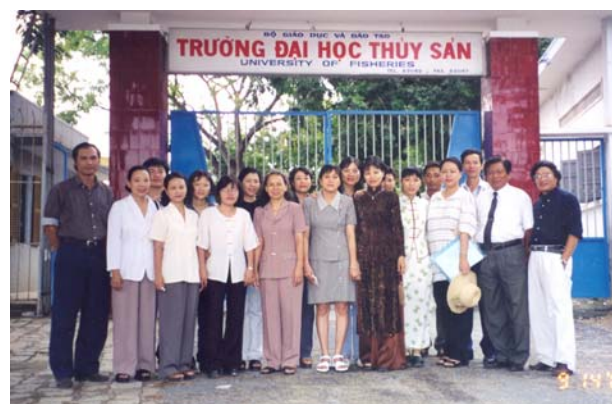
Tập huấn cho Thư viện ĐH Thủy sản Nha Trang, từ 11– 16/9/2000