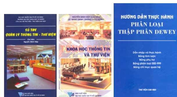
Sách chuyên ngành thông tin thư viện do Cán bộ Thư viện Cao học biên soạn