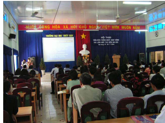
Hội thảo lần thứ nhất Liên hiệp Thư viện đại học Bắc-Nam tại Nha Trang, 19-20/7/2004