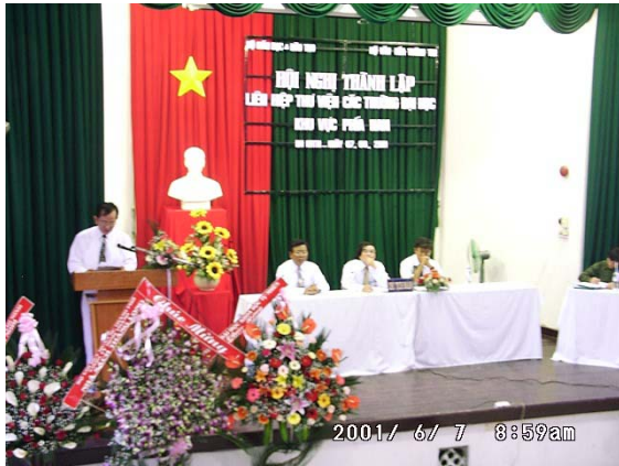
Hội nghị thành lập Liên hiệp Thư viện đại học khu vực phía Nam, 7/6/2001