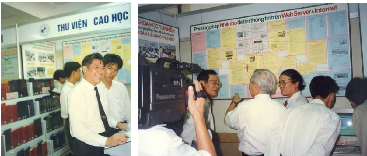
Thư viện Cao học giới thiệu công nghệ Web trong cuộc triển lãm tại Trung tâm Thông tin Khoa học Công nghệ TP. HCM ngày 19/4/1997

Năm 1997, Thư viện Cao học tham gia cuộc triển lãm “Tháng Sách, Báo, Tài liệu Khoa học – Kỹ thuật” từ 19/4 – 19/5/1997 tại Trung tâm Thông tin khoa học - Công nghệ TP. HCM. Thư viện Cao học đã giới thiệu “Phương pháp nhận bô” để tìm tin trên mạng Intranet và Internet; trình bày trang Web của Thư viện Cao học với việc truy cập từ 79 Trương Định đến máy chủ của Thư viện Cao học bằng “dialing up”. Có lẽ đây là lần đầu tiên một đơn vị thông tin thư viện giới thiệu công nghệ Web đến toàn thể mọi người tại một cuộc triển lãm về Khoa học công nghệ của TP. HCM.