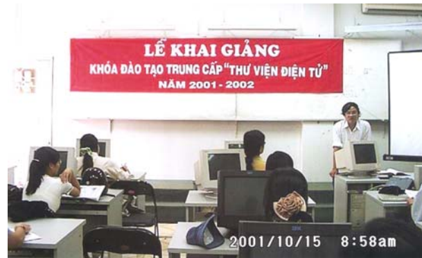
Khai giảng Khóa đào tạo trung cấp “ Thư viện điện tử ”, 15/10/2001

Ngày 15/10/2001, khai giảng Khóa đào tạo trung cấp “ Thư viện điện tử ” do Thư viện Cao học phối hợp với Trường Tin học viễn thông Biên Hòa tổ chức với