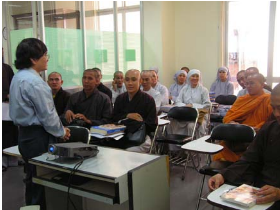
Lớp tập huấn “ Thực hành nghiệp vụ Thông tin Thư viện ” cho Tăng Ni toàn quốc