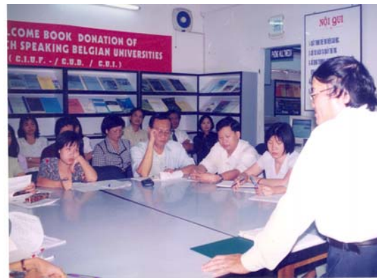
Tập huấn cho các thư viện thuộc ĐHQG-HCM tại Thư viện Cao học từ 30/11– 23/12/1998