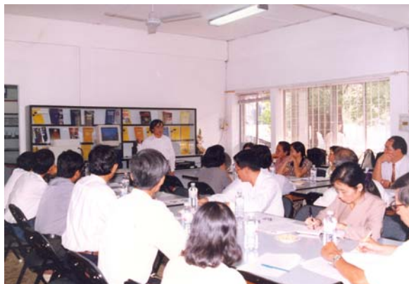
Cuộc Hội thảo đầu tiên tại Thư viện Cao học 22/2/1997

Trong suốt ba năm hoạt động sôi nổi nhằm thúc đẩy việc đổi mới nghiệp vụ thư viện đại học trong khu vực phía Nam, Câu lạc bộ Thư viện mà nòng cốt là Thư viện Cao học đã tạo nên một kết quả bất ngờ đã làm thay đổi hoàn toàn bộ mặt thư viện các trường đại học khu vực phía Nam. Hoạt