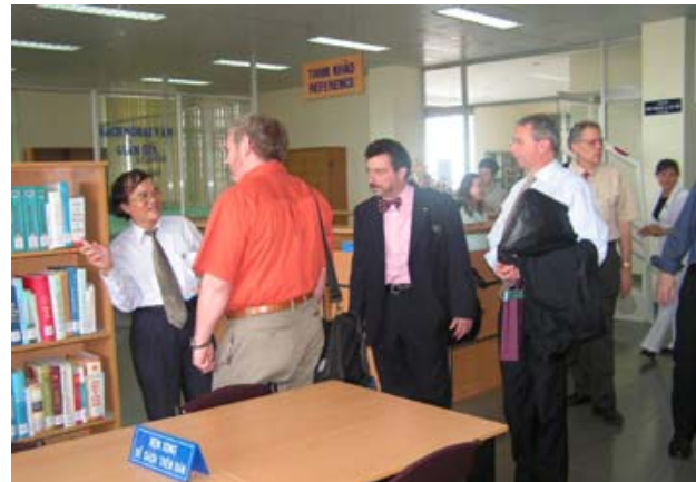
Phái đoàn JULAC – Hồng Kông tham quan Thư viện ĐH Khoa học Tự nhiên

Ngày 30/11/2006, đoàn cán bộ lãnh đạo các thư viện đại học ở Hồng Kông thuộc Ủy ban tư vấn cán bộ thư viện đại học liên kết JULAC (Joint University Librarians Advisory Committee) đã đến tham quan Thư viện ĐH Khoa học Tự nhiên TP. Hồ Chí Minh.