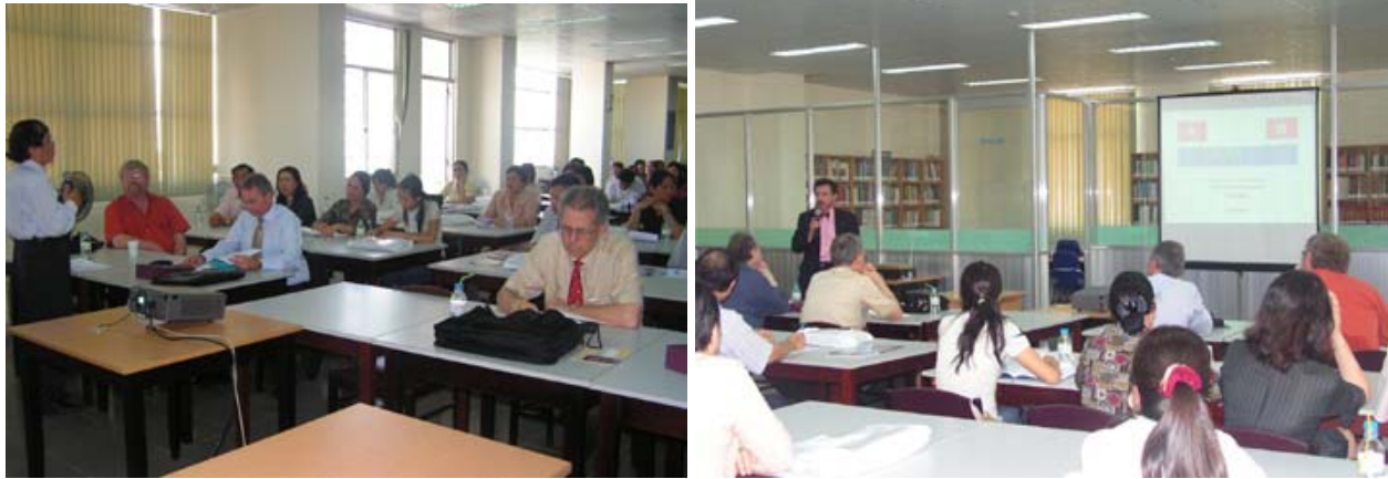
Quang cảnh Hội thảo FESAL